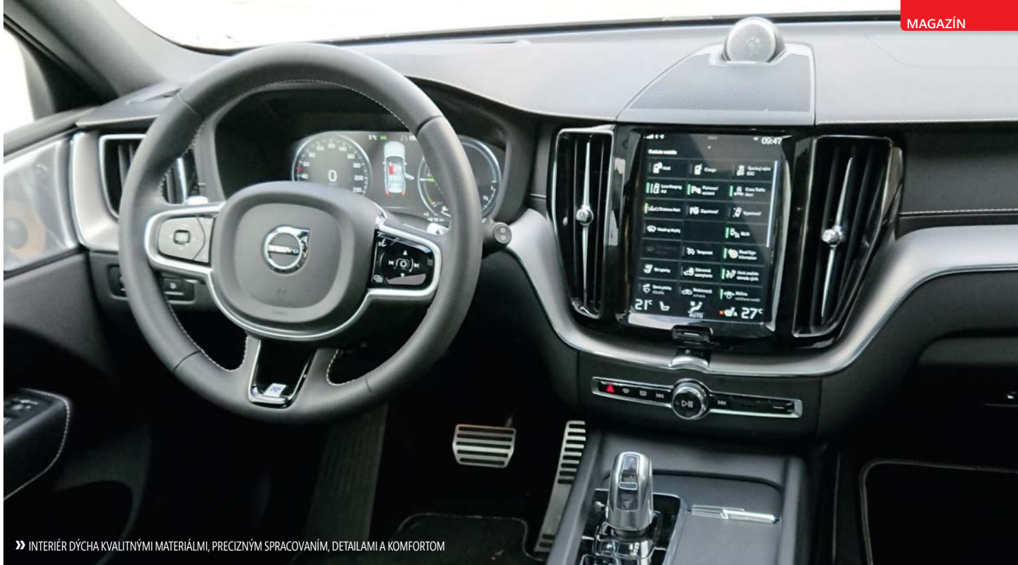
» INTERIÉR DÝCHA KVALITÍNYMI MATERIÁLMI, PRECÍZNÝM SPRACOVANÍM, DETAILAMI A KOMFORTOM

dividuálny a Off-Road režim (navrhnutý, aby zvýšil výšku jazdy pri použití pneumatického odpruženia a prispôsobil režim jazdy v podmienkach obmedzenej stability).