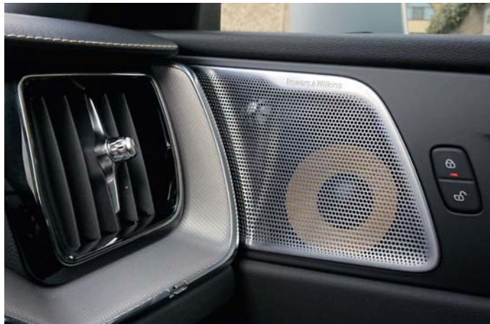
» AUDIOSYSTÉM BOWERS & WILKINS POSKYTUJE EXCELENTNÝ ZVUK AJ NÁDHERNÝ DIZAJN REPRODUKTOROV