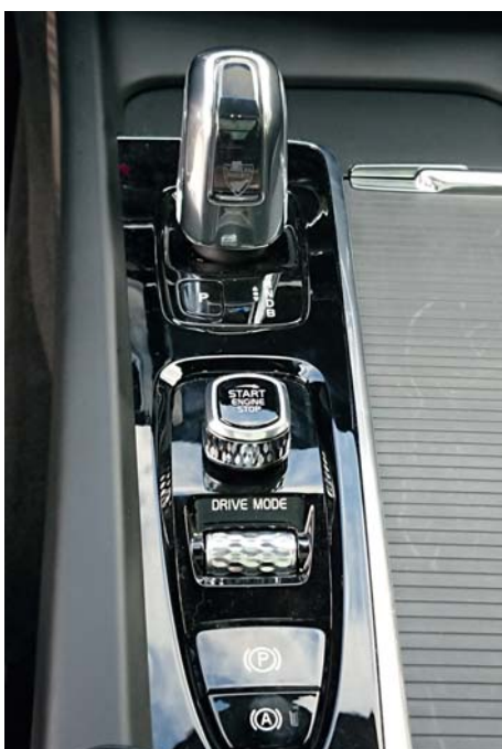
» KRÍŠTÁLOVÁ PODSVIETENÁ RIADIACA PÁKA JE UKÁZKOU VNÍMANIA LUXUSU "MADE IN VOLVO"