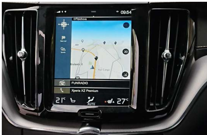
» NAVIGÁCIA SENSUS NAVIGATION POSKYTUJE VERTIKÁLNE ZOBRAZENIE MAPY

Režimy jazdy zahŕňajú Comfort (mix efektivity, výkonu a jazdy), Pure (maximálna efektivita), Power (najdynamickejšie nastavenie), All-Wheel Drive (pohon všetkých štyroch kolies, pričom krútiaci moment z benzínového motora prechádza na prednú nápravu, zadná náprava je poháňaná výhradne elektromotorom), in-