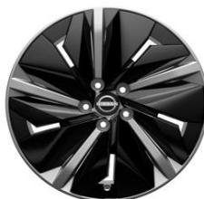
19" Disky kolies z ľahkých zliatin