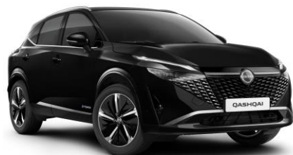
Čierna Pearl GAT - 600 €