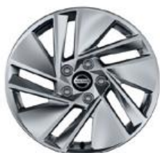
17" Disky kolies z ľahkých zliatin