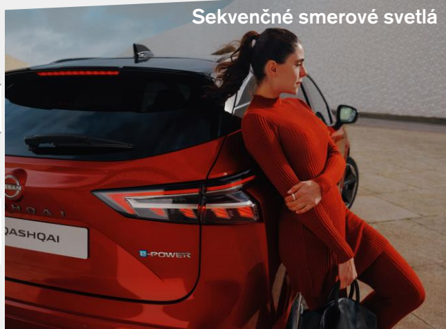
Sekvenčné smerové svetlá