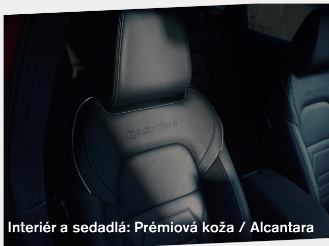
Interiér a sedadlá: Prémiová koža / Alcantara