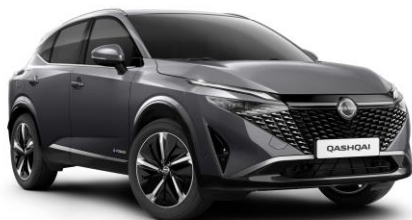
Sivá Gunmetal KAD - 600 €