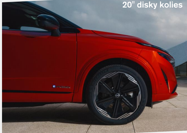
20" disky kolies