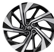
20" Disky kolies z ľahkých zliatin