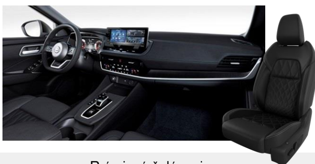
Prémiové čalúnenie Prešivaná koža / Alcantara [Z]