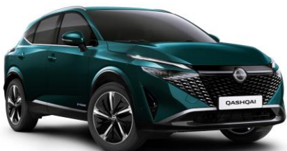
Zelenomodrá Ocean FAP - 800 €