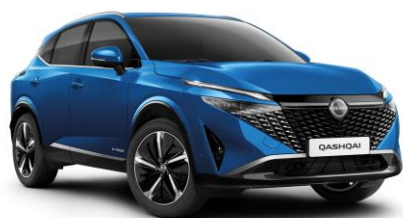
Modrá Magnetic RCF - 800 €