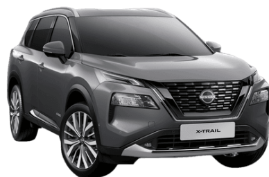
Sivá KAD - 700 €