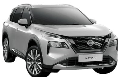
Strieborná K23 - 700 €