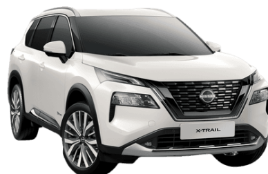
Biela Pearl QBE - 850 €