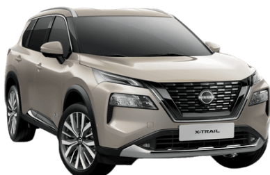
Strieborná Champagne KAY - 850 €