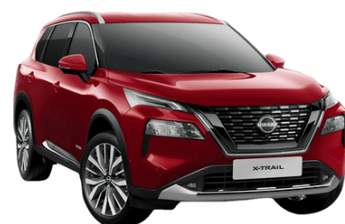
Červená Tinted NBL - 850 €