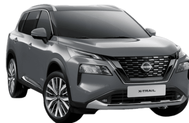
Sivá Ceramic KBY - 850 €