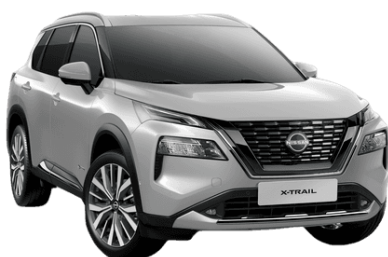
Strieborná K23 - 700 €