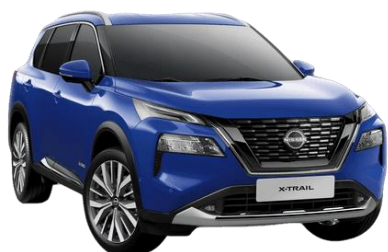
Modrá RBY - 700 €