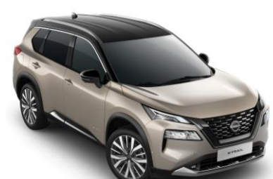
Strieborná Champagne - Čierna XEW - 1 350 €