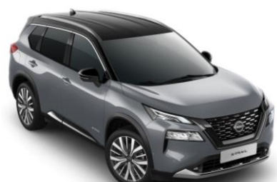
Sivá Ceramic - Čierna XEX - 1 350 €