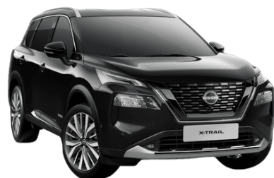
Čierna G41 - 700 €