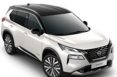
Biela Pearl - Čierna XKJ - 1 350 €