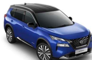
Modrá - Čierna XEU - 1200 €