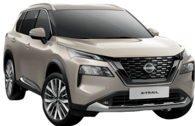
Strieborná Champagne KAY - 850 €