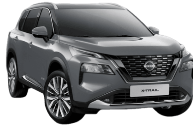
Sivá Ceramic KBY - 850 €