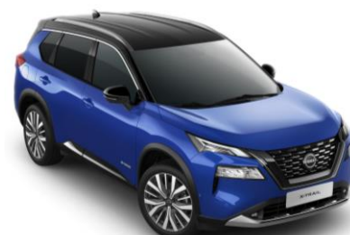
Modrá - Čierna XEU - 1200 €