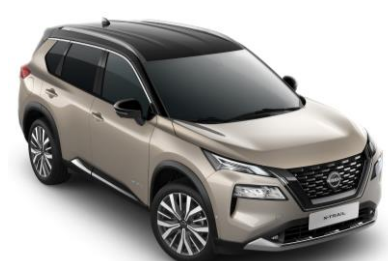
Strieborná Champagne - Čierna XEW - 1 350 €