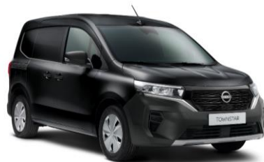
Čierna Enigma GNE – 600 €