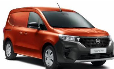
Oranžová Terracotta CNZ - 600 €