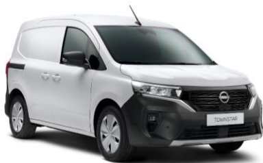
Biela Mineral QNG (bez príplatku)