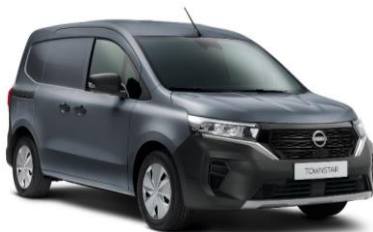
Sivá Urban KPW – 300 €