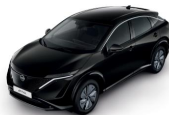
Čierna Pearl GAT – 800 €