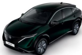
Zelená Aurora DAP – 800 €