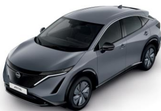
Sivá Ceramic KBY – bez príplatku