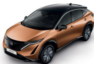
Medená Akatsuki / Čierna XGJ – 1300 €