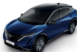
Modrá Pearl / Čierna XGU – 1300 €