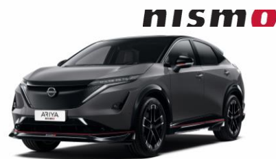
Sivá Gunmetal KAD - bez príplatku