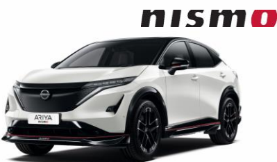
Biela Pearl / Čierna XGA – 1300 €