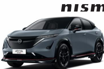
Sivá Stealth / Čierna YAZ – 1300 €