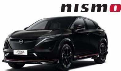
Čierna Pearl GAT – 800 €