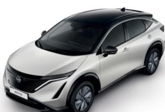
Biela Pearl / Čierna XGA – 1300 €